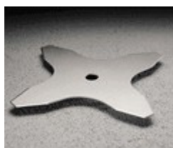
Рис. 6. Неправильный диск, слишком большие зубья

Если все сделано правильно, то сенокос ваш будет выглядеть вот так: