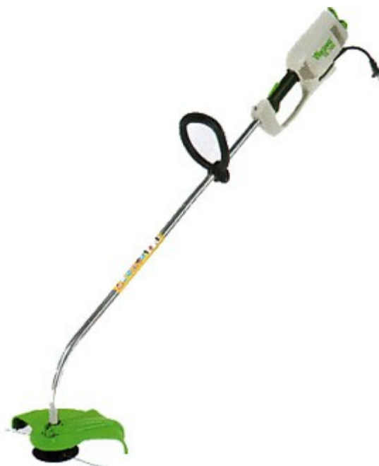
Рис. 2. Неправильные

Во-вторых, нужен специальный металлический диск, с маленькими зубчиками и большим основанием на котором собственно и удерживается трава. Он обычно бывает либо 4 либо 8 зубчатым, самое главное, чтобы диск был с небольшими зубчиками: