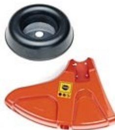
Рис. 4. Ограничительная чашка и кожух

В четвертых, специальная ограничивающая чашка, которая не даёт диску соприкоснуться с землёй. Чашки бывают, либо на подшипниках (более долговечные), либо простые: