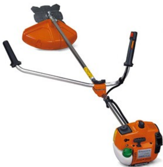
Рис. 1. Правильные рукояти

Во-первых, хороший инструмент, желательно с рукоятями велосипедного типа, т.к. они более удобны при удерживании, и при косьбе с ними меньше утомляешься: