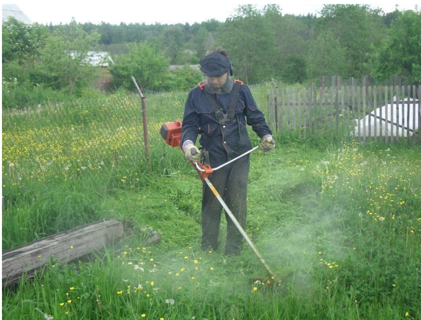
Рис. 5. Работа с триммерной головкой

С таким оборудованием, вы точно сможете заниматься сенозаготовкой, но никак ни с триммерной головкой и леской. В этом случае любая мотокоса рубит траву так, что иногда вокруг косаря-оператора стоит туман: